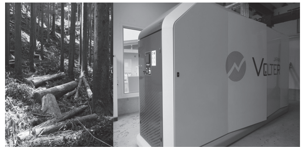
▲ 未利用木材と木質バイオマスボイラー