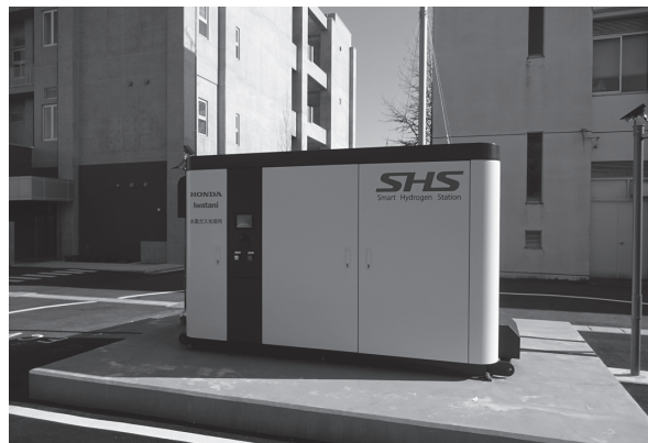
▲ スマート水素ステーション

本施設は、平成29年3月に整備された商用水素ステーション及び水素エネルギー利活用型コンビニの視察等と合わせ、再生可能エネルギーを活用した環境に優しい水素製造設備として随時施設見学の受け入れを行うなど、県における水素エネルギーの普及・啓発拠点の一つとして活用しています。