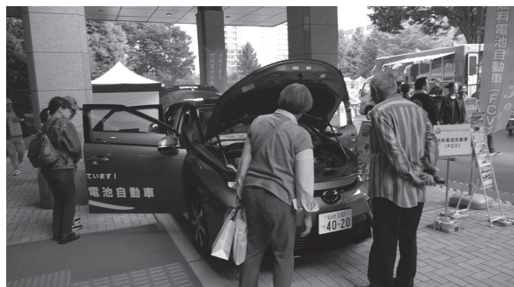
▲ イベントでのFCV展示

大学等と連携して、事業者等を対象とした水素エネルギー・燃料電池に関する産業セミナーを開催するなど、水素エネルギー関連産業の育成、活性化のための取組を実施しました。