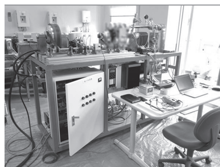
▲自動制御システムを搭載した自立型廃熱エンジンの冷却試験の様子