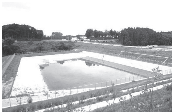
▲事業区域に調整池を設置し、水害防止を図っている。

違反した場合は罰則規定もあり、こうした許可制度によって、無秩序な開発を防止しています。