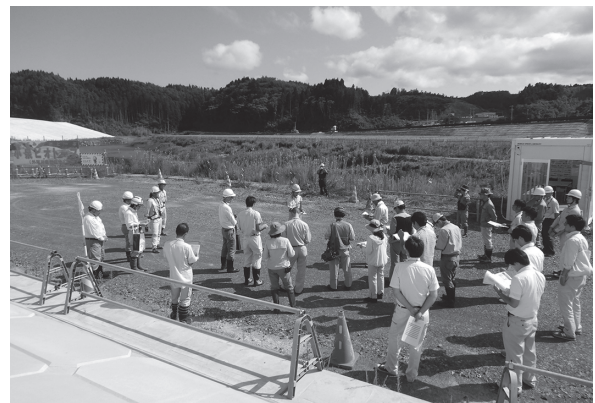
▲昨年8月の現地検討会（気仙沼市津谷川）

今後、工事の着手前、施工中の環境調査に加え、工事後にもモニタリングを行い、環境配慮による取組の効果検証を実施してまいります。