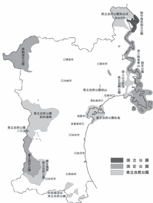
▲図2-3-1-1 自然公園位置図