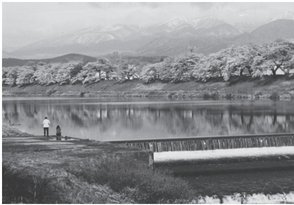
白石川堤防の桜並木と蔵王連峰（大河原町）