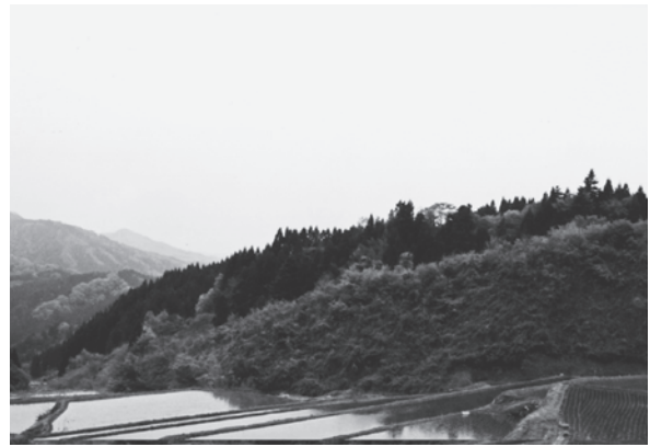
沢尻地区の棚田（丸森町）