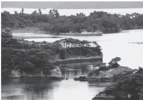
野々島の美しい島々（塩竈市）