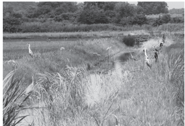
水路に集うサギ（登米市）