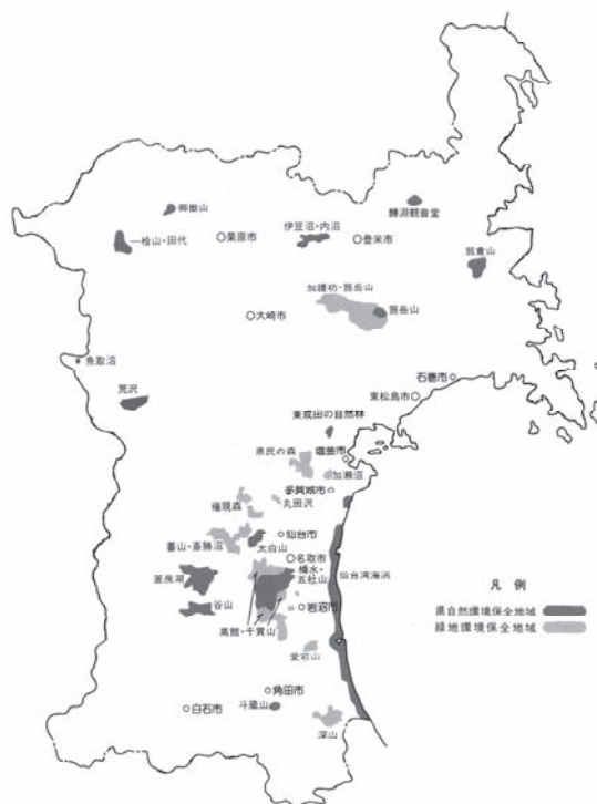
▲図2-3-1-2 県自然環境保全地域・緑地環境保全地域位置図