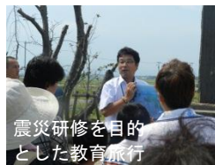
震災研修を目的 とした教育旅行