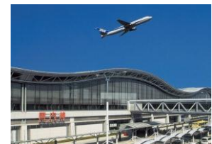
早期の民営化を目指す仙台空港