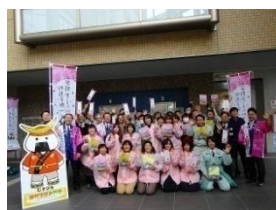
平成25年DCのおもてなし