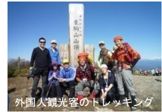
外国人観光客のトレッキング