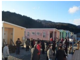
女川町 復旧した宿泊施設