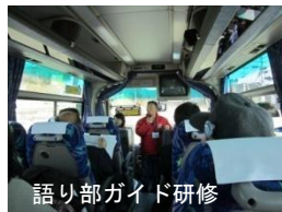
語り部ガイド研修