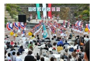
慶長使節船「サン・ファン・パウティスタ」イベント