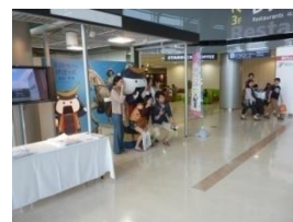
航空会社と連携した観光PR