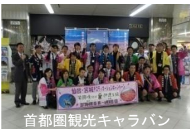
首都圏観光キャラバン