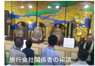
旅行会社関係者の招請