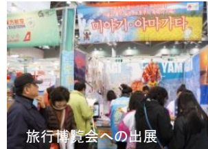
旅行博覧会への出展