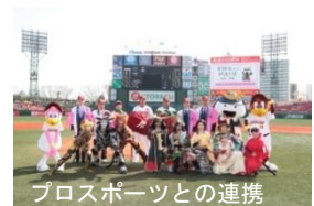
プロスポーツとの連携