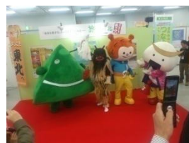
隣接県や東北観光推進機構と連携した観光PR