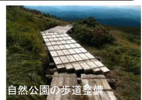
自然公園の歩道整備