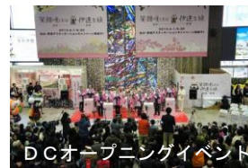
DCオープニングイベント