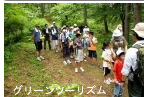
グリーンツーリズム