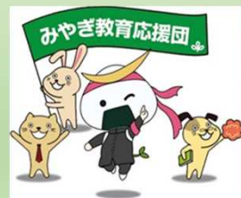
みやぎ教育応援団 イメージキャラクター

家庭、地域、学校が協働して子供を育てる仕組みの一つとして設立したもので、協働教育の人材バンクといえます。子供たちの教育を支えようとする企業、団体、個人等を教育応援団員として登録し、学校等の要望に応じて子供たちの学びを支援しています。