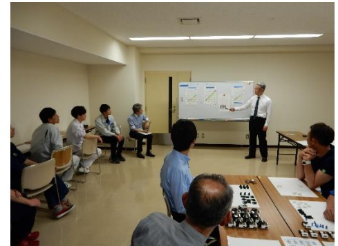
生産現場改善支援事業(改善セミナー)

学生の自動車産業に対する理解の向上や関心を高めるため、開発設計分野を中心とした人材育成講座を実施