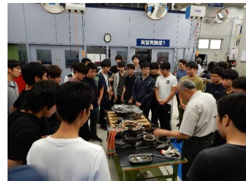
みやぎカーインテリジェント人材育成センター事業