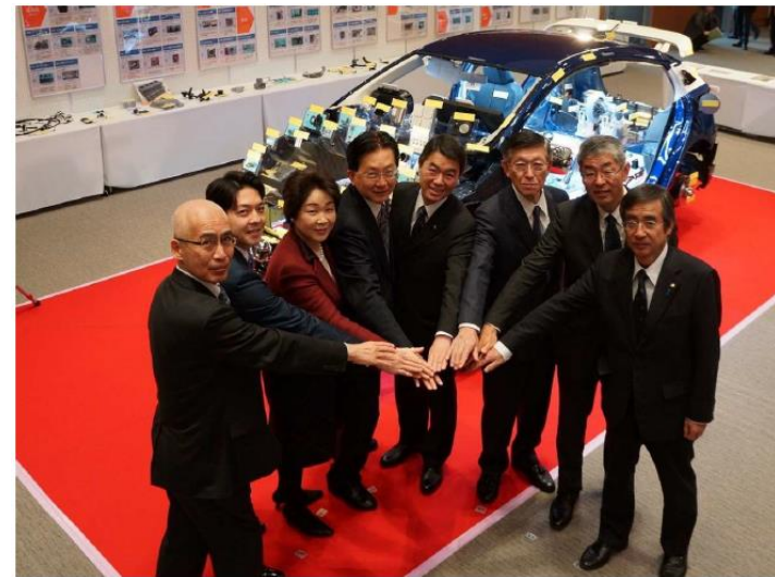
8道県知事によるトップセールス