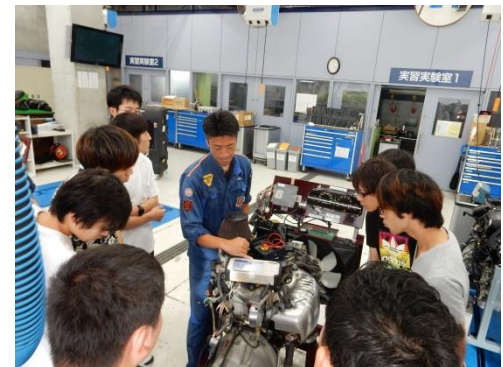
みやぎカーインテリジェント人材育成センター事業