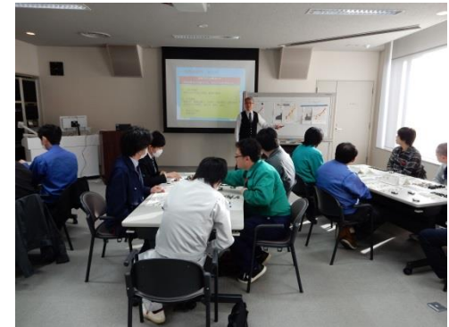
生産現場改善支援事業(改善セミナー)

学生の自動車産業に対する理解の向上や関心を高めるため、開発設計分野を中心とした人材育成講座を実施。