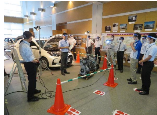
自動車の生産と新技術編