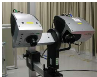
非接触光学式3次元デジタイザシステム (COMET5)

日程：2010年2月26日(金) 時間：13:30～16:00 会場：宮城県産業技術総合センター 大会議室 (〒981-3206 宮城県仙台市泉区明通2-2) 定員：50名(先着順) 参加費：無料