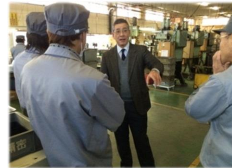
生産現場改善支援事業

学生の自動車産業に対する理解の向上や関心を高めるため、開発設計分野を中心とした人材育成講座を実施