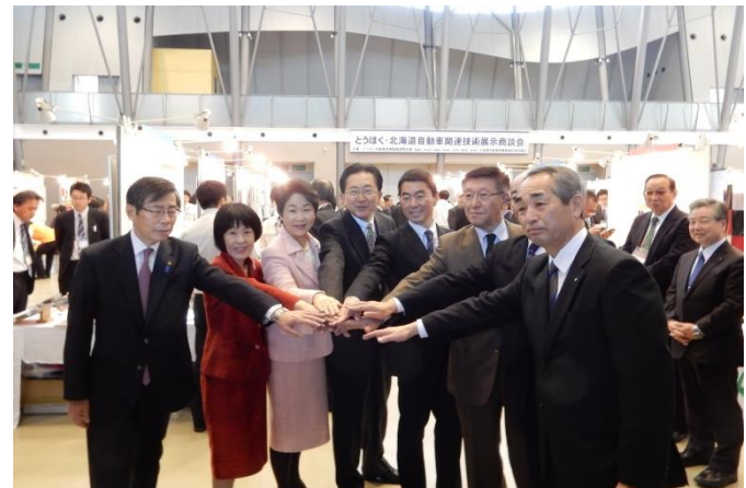
8道県知事によるトップセール