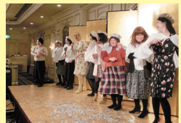
楽しい忘年会の様子、とってもアットホームな職場ですよ。