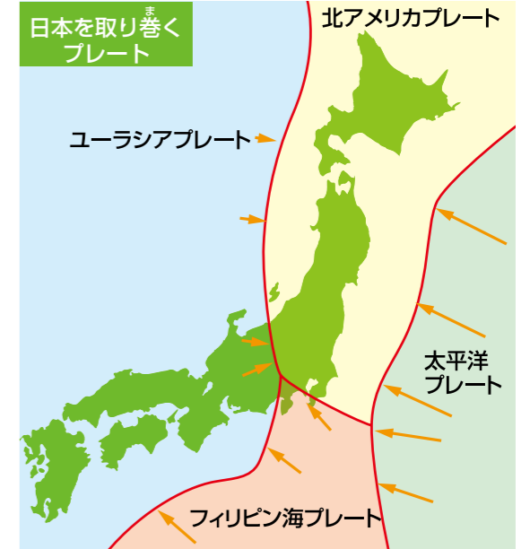
参考：広島大学 片山郁夫著「プレート収束帯の地震発生について」東京大学地震研究所 瀬野徹三著 公開講義「プレートテクトニクスと日本列島付近の地震」

海洋プレート(こげ茶色)は、白い矢印の方へゆっくり動いています。この動きのせいで、陸のプレートは青い矢印の方へ引きずり込まれています。そのため、陸のプレートが元にもどろうとする力がたまり、はね上がると(黄色矢印)地震が発生します。