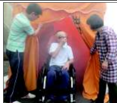
煙避難体験（宮城県立船岡支援学校）