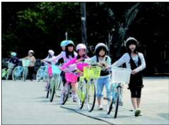
合同交通安全教室 (山元町立中浜小学校・山元町立坂元小学校)