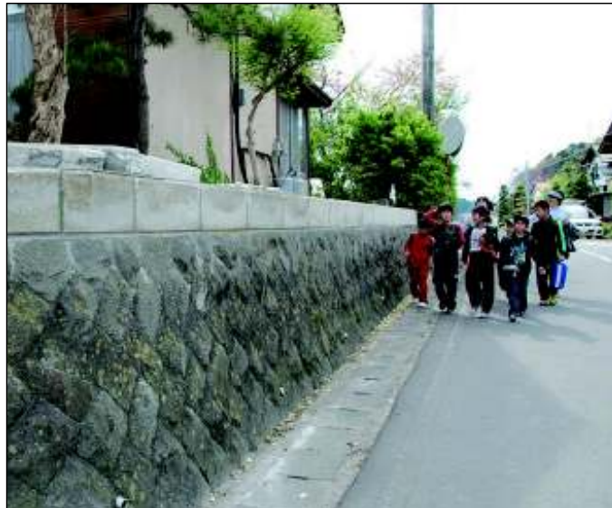
通学路点検（栗原市立有賀小学校）