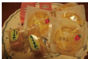
看板商品群 (洋菓子)

一方、当拠点では、商標の活用戦略を担当し、本菓子店社長の意向が自社商品の権利化、ブランド化であることを踏まえつつも、全ての商品を商標登録申請するのではなく、費用対効果や権利化の可能性、本店舗の将来的な展開に役立つブランド化の可能性