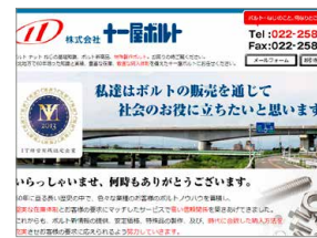
Web サイトのトップページ

短期には「Web 強化によるリアル営業への誘導」、中期では「締結サービス実施のための体制づくり（部分最適を全体最適に）」を進め県内シェア 1% を 5 年後に 2% まで向上させるよう提案した。Web 強化についてはサイト訪問者の足取りを分析し、閲覧の多いページには詳細な説明を作りこむと同時に、ボルト・ネジの技術データ、現場向けノウハウ等も掲載し、問い合わせ件数の増加を狙った。