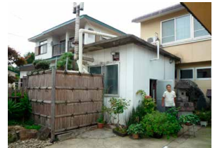
地下450mから汲み上げる源泉