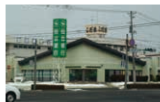
仙台銀行 東部工場団地支店

以上により、餡の材料と金箔が調達できたため、他社と差別化した新商品の販売に向けて試作品開発を行っている。