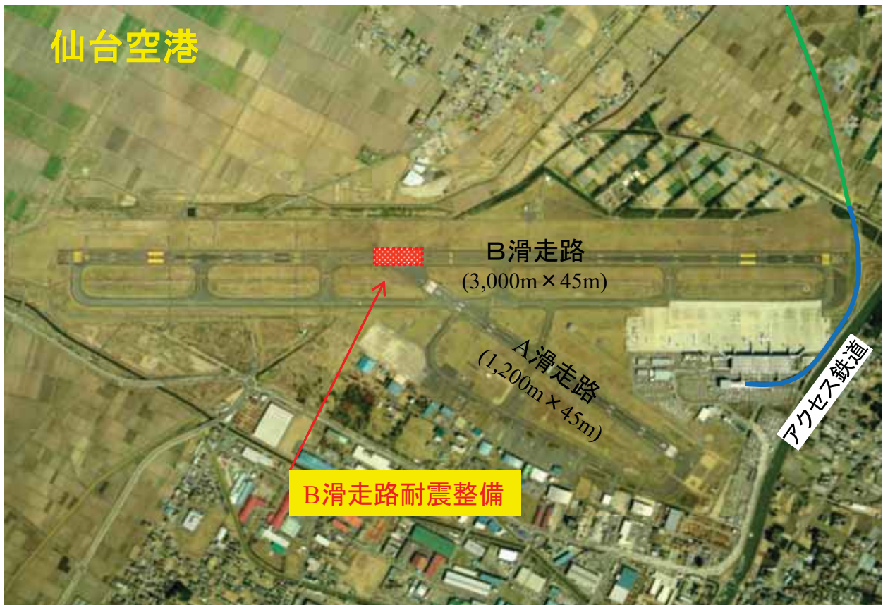
耐震整備工法 (地盤改良工法)

宮城県沖地震及び長町利府断層帯地震への対応として、緊急輸送の拠点となる空港、及び航空輸送上重要な空港として求められる空港機能を確保すべく、被災時においても通常運用と同様な施設を供用可能な状態とすべく、老朽化した、B滑走路及び誘導路の地盤改良を引き続き行います。