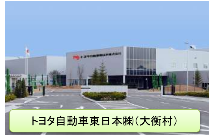
トヨタ自動車東日本(株)(大衡村)