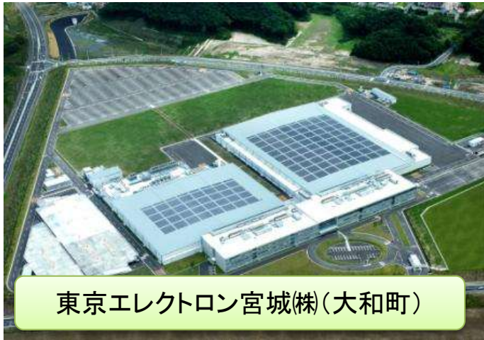
東京エレクトロン宮城(株)(大和町)