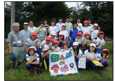
▲最後にみんなで記念撮影