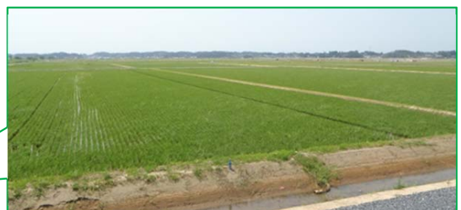
▲作付けされた農地の様子