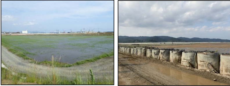
▲大曲地区3.1haの直播栽培(東松島市)▲大川地区長面工区(石巻市)

沿岸部の農地の復旧・復興状況について学ぶことを目的に、6月22日に東部地方振興事務所で実施している事業（牡鹿地区、大曲地区、三輪田(みのわだ)地区、大川地区）の現地研修を行いました。現地は復旧・復興工事が進み、営農を再開している地区や、工事着手したばかりの地区、今後工事着手予定の地区等、状況は様々でした。沿岸部は農業農村整備関連のみならず、他部局で進めている復旧・復興事業の現場が錯綜しており、往来するダンプトラックとクレーンの多さに息をのみ、内陸部との違いを肌で感じました。震災から6年が経過しますが、復旧・復興の途上にある現場を目の当たりにし、東日本大震災の甚大さ、復旧・復興の難しさを再認識しました。