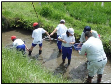
▲生き物調査の様子

梅雨の晴れ間の当日、捕まえたザリガニやドジョウの大きさを比べ合ったりする子どもたちの楽しそうな声が響き、「また来て欲しい！」の一声に心が癒やされました。