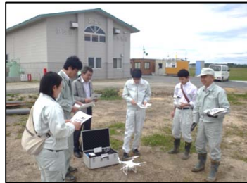
▲ドローン操作の様子

登米地域事務所では平成28年度にドローンを導入しましたが、新年度になり人事異動で職員が入れ替わったことからドローンの操作研修を行いました。伊豆沼2工区で実際に一人一人飛行のための準備・操作を体験し、その後、撮影した動画・画像データの加工方法について室内で研修を行いました。現在、伊豆沼2工区地区がほ場整備工事中ですので積極的に活用していきます。