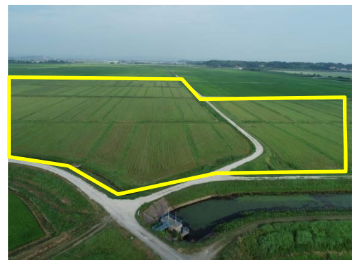
▲今年度施行区域の様子