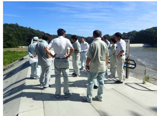
▲奥松島地区の海岸堤防

沿岸部で実施している復旧復興事業が現在どのようになっているか学ぶため、8月28日に現地研修会を実施しました。今回は、東部地方振興事務所の管内に位置する「大川地区」、「奥松島地区」を視察し、東部地方振興事務所の職員から説明を受けました。現在は完成に向けて作業を進めていますが、換地等の調整作業に時間がかかっているとのことでした。また、内陸部の事業と異なる、復旧復興事業の難しさがあるということで、大変勉強になった研修でした。