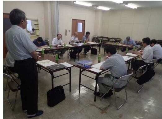
▲戦略会議の様子 (北上川沿岸中田地区土地改良区にて)