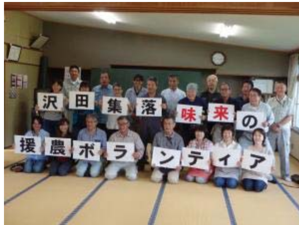
▲ボランティア後の集合写真

当日は「味来」の他にかぼちゃの収穫のお手伝いなども作業内容に加わり、ボランティアの皆さんは畑で汗を流していました。