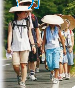
ボランティアの皆さんに励まされながら歩きます

大崎地域の小学四年生から六年生までを対象にした、おおさき100km徒歩の旅が八月九日から十三日まで実施されます。この事業は、真夏の太陽の下、百二十人の子どもたちが大崎地域一市四町を横断する100kmの道のりを歩き通すというイベントです。これまでは社古川青年会議所の主催として運営を行ってききましたが、今年から新たにNPO法人TERAKOYAも参画して設立された実行委員会が、地域の皆さんや百人を超えるボランティアの皆さんと一緒に、なつて事業に取り組みします。子どもたちには自分のふるさと