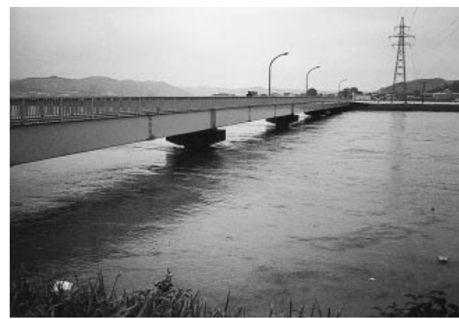
集中豪雨により増水した河川

近年、大型の台風や梅雨前線の活動による集中豪雨が全国的に頻発しています(図1)。