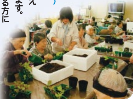
ハポタンの鉢上げの様子

園芸療法とは、園芸を手段として心身の状態を改善することです。宮城県上沼高等学校では平成十五年から毎年授業の一環として地元の老人保健施設でボランティア活動を実施しています。