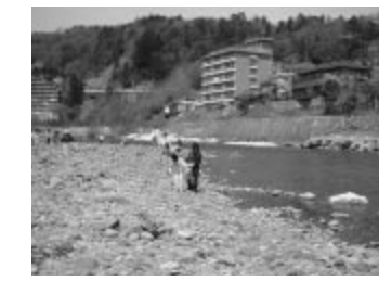
広瀬川での清掃活動

県では、これらの活動団体や学校などを支援するとともに、河川敷を運動や散歩など趣味や活動の場として県民の皆さんに開放していきます。