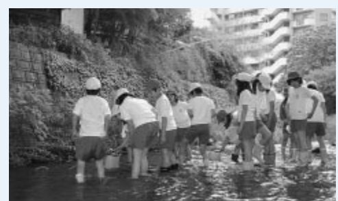
梅田川で生き物を観察する子どもたち

「ザリガニを見つけた!」子どもたちの歓声が響きます。仙台市立北六番丁小学校では、四年前から学区内を流れる梅田川を舞台にさまざまな活動を行っています。 「総合的な学習の時間」を活用した活動では、四年生と五年生が、地域の方から梅田川の歴史を学んだり、梅田川に生息する生き物を観察したりしています。ワラと炭を利用して作った水質浄化装置で梅田川の浄化にも取り組んでいます。