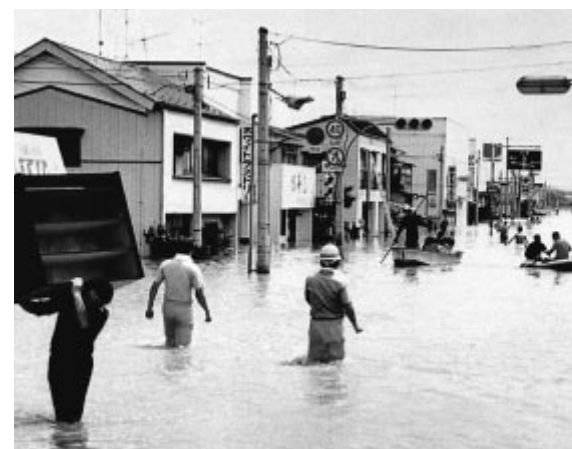
浸水した旧鹿島台町内

これに伴い、県内では、南部の平野部を中心に大雨となり、所によっては降り始めからの雨量が二百年に一度の規模の四〇〇ミリを超える記録的な豪雨となりました。 この豪雨は、死者五人、負傷者十二人の人的被害のほか、吉田川や阿武隈川の堤防が決壊し、多くの家屋が浸水するなどの大きな被害をもたらしました(表1)。