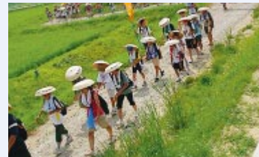
ふるさとの大自然の中を進みます

「おおさき100km徒歩の旅」実行委員会 NPO法人TERAKOYA(内) ☎0226(24)5501