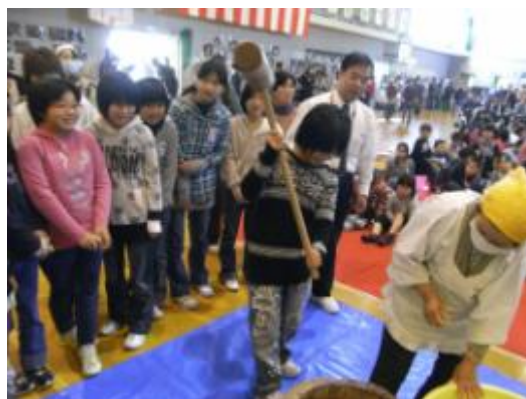
一人一人餅をつき、収穫の喜びを味わいました。