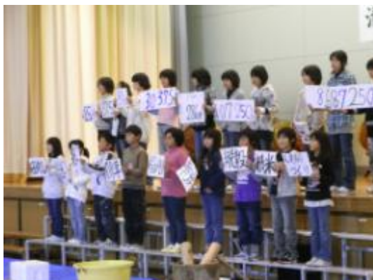
5年生は、春から取り組んできた活動と稲作について発表しました。