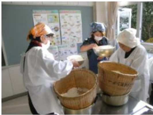
餅つき用の米をボランティアの方々が準備しました。