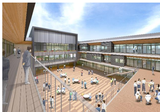
<中庭のイメージ図>

※ 「グローバル」とはグローバルとローカルを合わせた造語であり、「グローバルな教育活動」では今日的な問題や課題をローカルな視点から捉えるとともに、グローバル社会と対称化できる力を育成します。