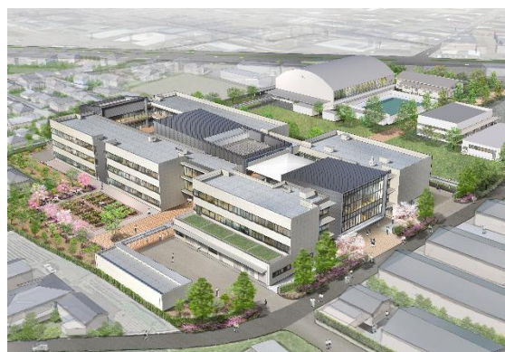
<新校舎のイメージ図>