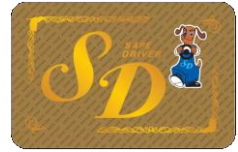
スーパーゴールドカード