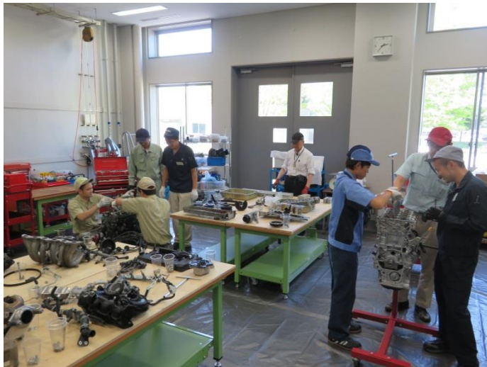
自動車部品機能・構造研修