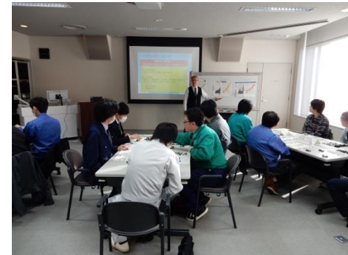
生産現場改善支援事業(改善セミナー)

学生の自動車産業に対する理解の向上や関心を高めるため、開発設計分野を中心とした人材育成講座を実施。