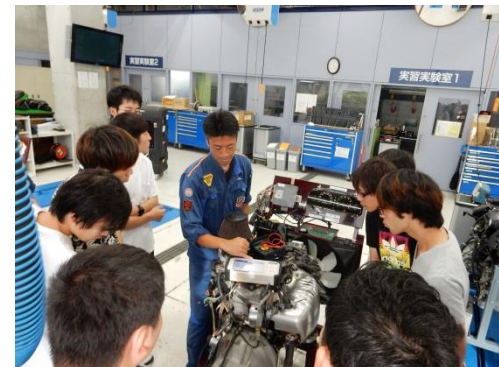
みやぎカーインテリジェント人材育成センター事業