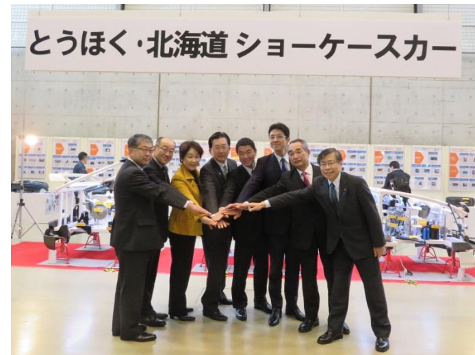
8道県知事によるトップセールス