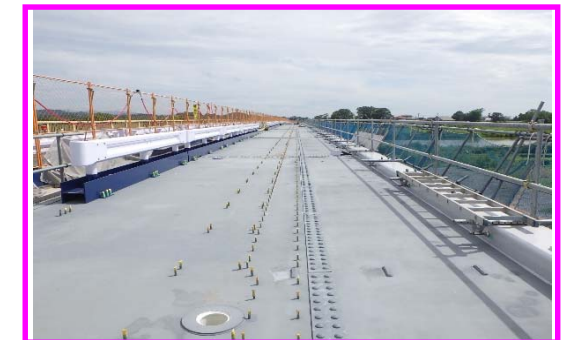
(舗装前の橋桁上面の状況)