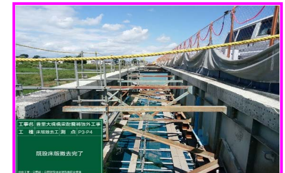
(古い床版の撤去完了状況)