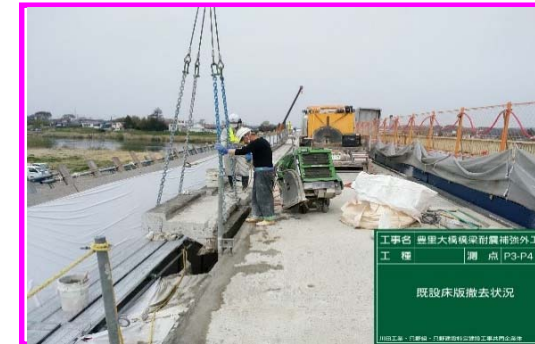
(古い床版の撤去状況)