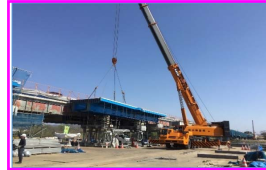
(大型クレーンによる桁架設状況)