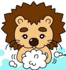
石巻保健所 オリジナルキャラクター 『てあらいおん』

遊んだあとは手洗いを忘れずに！体調がよくないときは、お友達と遊ばないようにしよう。