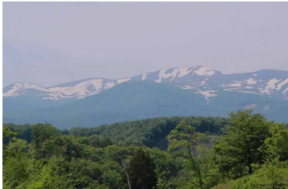
栗原市から、その美しい姿が望める名峰、栗駒山。