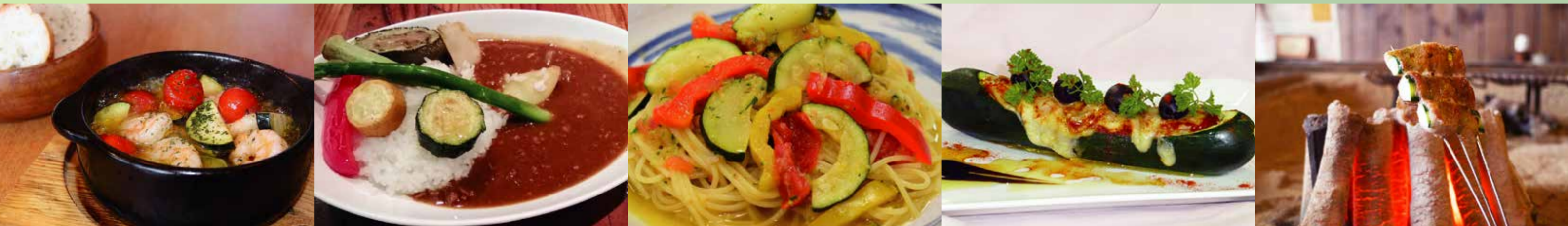
(写真は昨年開催時のメニュー例)