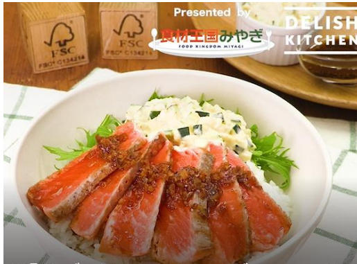
簡単ズッキーニタルタルで♪ 焦がし醤油の炙りみやぎサーモン丼

「誰でも簡単においしく作れるレシピ」をコンセプトに掲げ、毎日料理をする人（主に主婦層）をターゲットにしているレシピサイト「DELISH KITCHEN」で、7月に「栗っこズッキーニ」と「みやぎサーモン」を使用した料理レシピ動画を配信します。