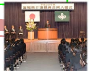
介護職員合同入職式