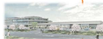
亶理町保健福祉センター 完成イメージ