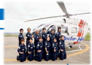
宮城県ドクターヘリ