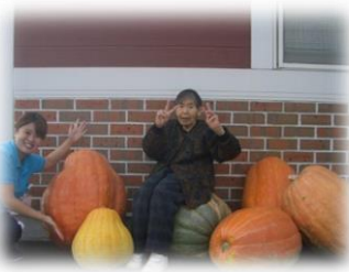
ハロウィンかぼちゃ