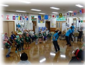
子ども達と運動会