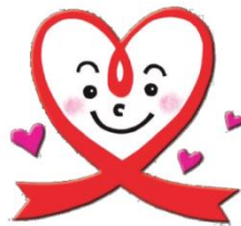
宮城県自死対策推進センター（みやぎほっとするーセンター）「ほっとちゃん」

宮城県保健福祉部障害福祉課及び宮城県精神保健福祉センターが中心となり運営することとし、保健所等関係機関と綿密に連携しながら、県内市町村における自死対策の推進を支援します。