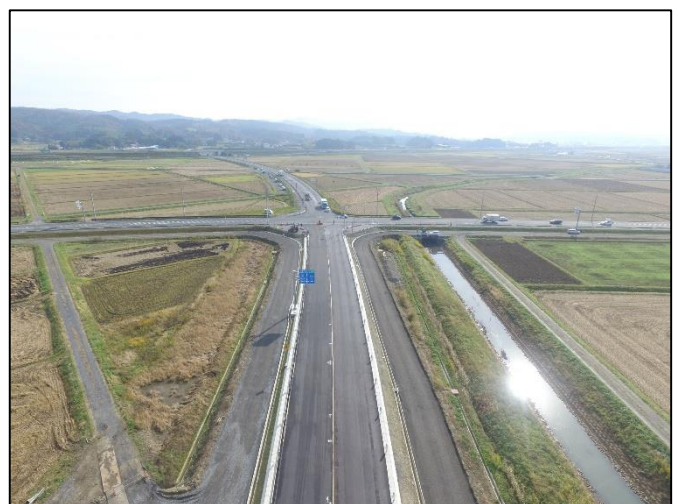
登米中田交差点部

お問い合わせはこちらまで 宮城県東部土木事務所登米地域事務所 道路建設第二班 〒987-0511 宮城県登米市迫町佐沼字西佐沼150-5 電話：0220-22-5115 E-mail：et-tmdbkk2@pref.miyagi.jp