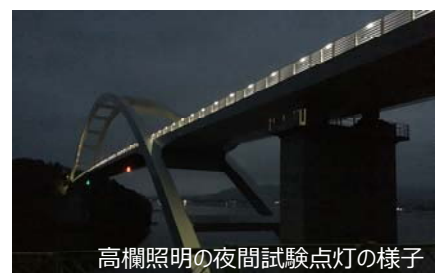
高欄照明の夜間試験点灯の様子

現在は、水道や電気などのライフライン設置工事も完了し、今後は、舗装工事や安全施設工事を行い、供用開始に向けて進めてまいります。