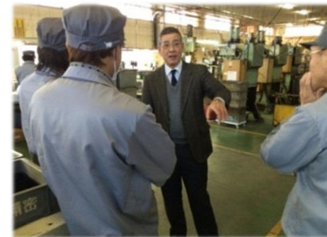
生産現場改善支援事業

学生の自動車産業に対する理解の向上や関心を高めるため, 開発設計分野を中心とした人材育成講座を実施