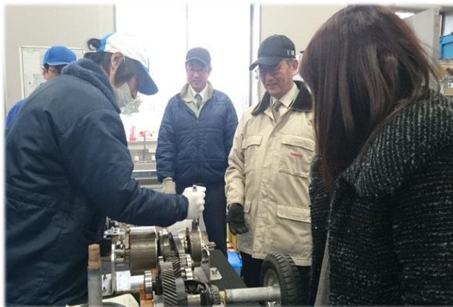
自動車部品機能・構造研修