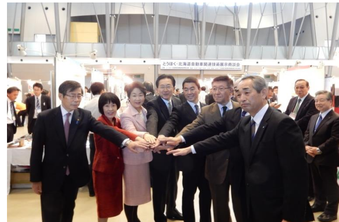
8道県知事によるトップセール