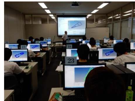
みやぎカーインテリジェント人材育成センター事業