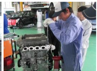
石巻高等技術専門校体験学習