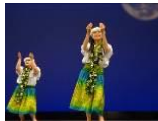
フラガールズ甲子園