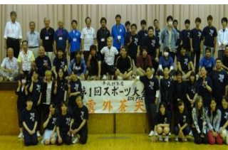
【学校行事】スポーツ大会