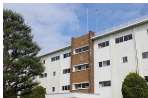
【校舎風景】校舎と校章