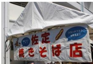
【学校行事】佐高祭・模擬店