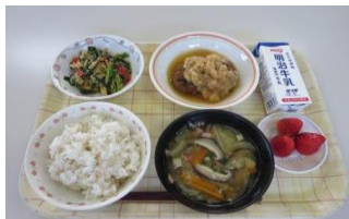
【給食】栄養バランスのよい給食「伊達な献立コンクール入賞」