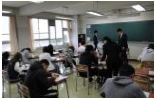
【授業風景】学び直し