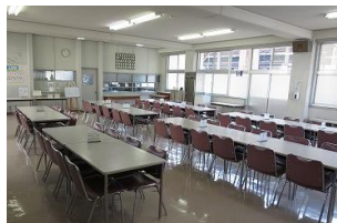
【給食】給食室(食堂・厨房)