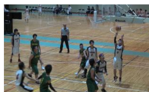
【部活動】バスケットボール部・県大会