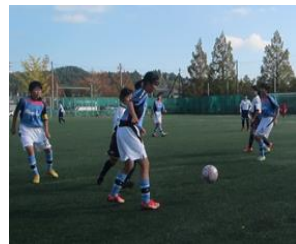
“ミヤイチのなでしこ” サッカー部