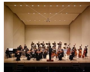
公立校唯一の管弦楽部