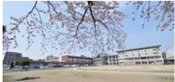
歴史と伝統ある校舎