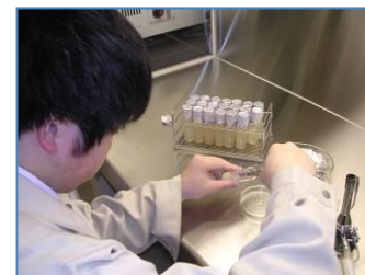
実習風景5(化学技術科)