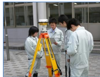
実習風景1(土木情報科)