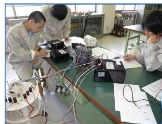
実習風景3(電気電子科)