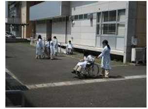
介護実習(福祉系列)