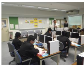
進路別オリエンテーション