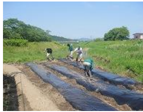
農業実習(農学系列)