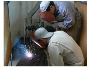
機械実習(機械系列)