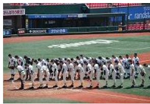
春季県大会(野球部)