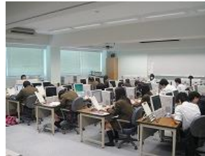
情報処理実習(情報系列)