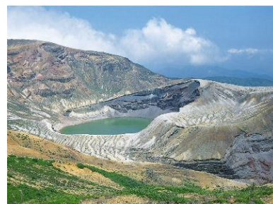
蔵王国定公園 御釜