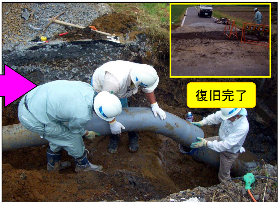
漏水箇所の復旧状況（栗原市花山）