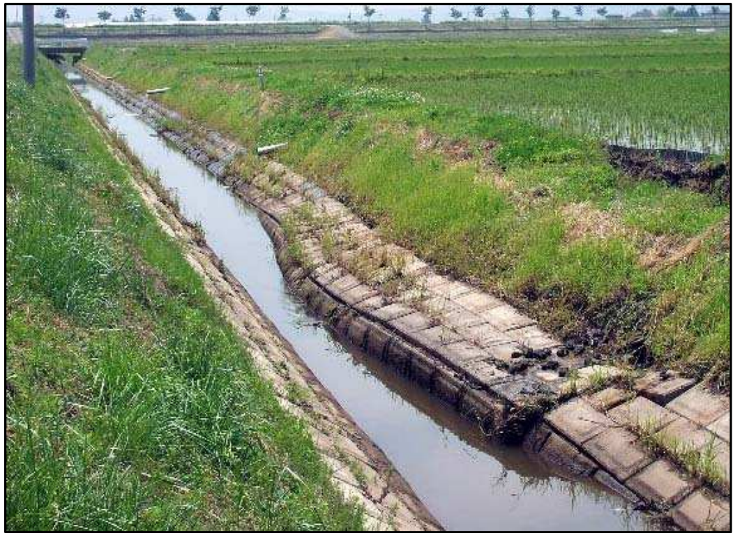
排水路ブロックの破損（登米市南方）