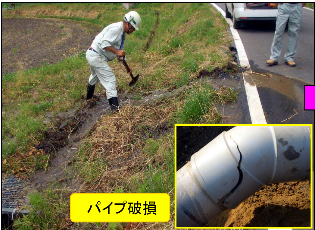
パイプラインからの漏水（栗原市花山）