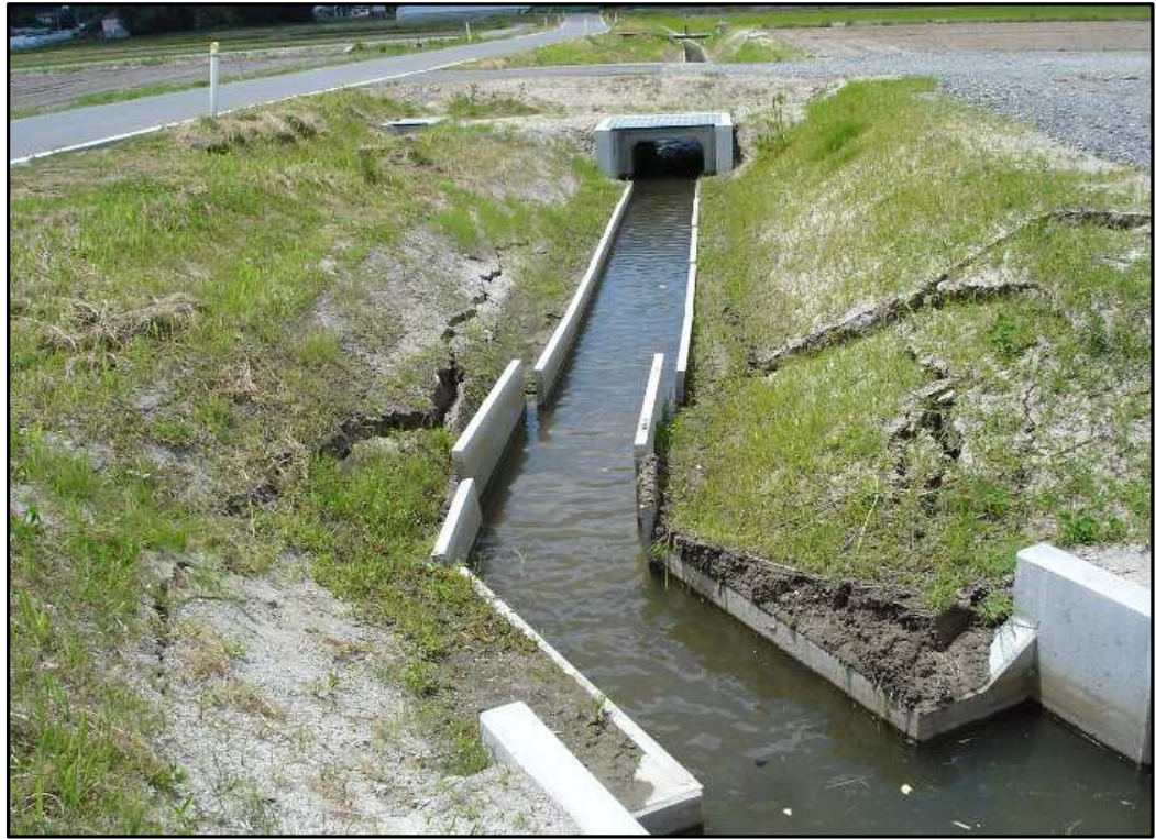
排水路の法面崩壊（大崎市田尻）