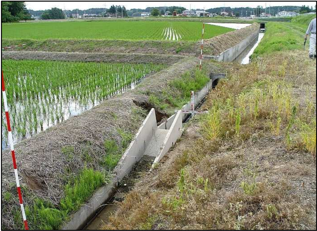
排水路の隆起（大崎市岩出山）