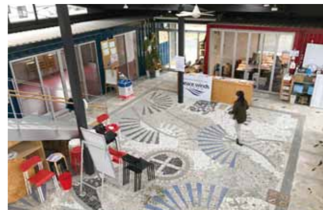
▲晴谷驛（ハレバレー）内部の広場

びば!! 南三陸の事務局は、当初PWJのプレハブ事務所の一部で活動していましたが、徐々に活動の輪が広が