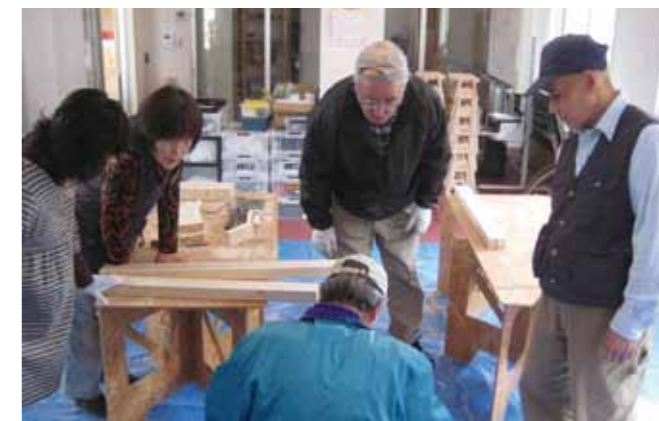
▲木工ワークショップの風景

り、参加人数や活動に使用する機材や道具も増えてきたことから、各地区の公民館や集会場、ポータルセンターなどを借りて活動や講座を続けていました。しかし、高齢者の皆さんがいつでも安心して集え、楽しい活動を通じて地域に貢献できる場が必要と考え、PWJと協働で事務局機能を持った拠点となる施設をつくることにしました。建設資金は、PWJからの支援に加え、寄付金を集め、2015年7月、南三陸町入谷に施設「晴谷驛（ハレバレー）」ができました。名称は、「晴」れやかな顔で活動し、拠点を置く入谷の「谷＝バレー」、多くの人が賑やかに交錯・交流する「駅（プラットフォーム）」のようになったら、という願いからつけられています。びば!! 南三陸は、同年7月30日にNPO法人化し、拠点で様々な講座や活動などの企画を展開しています。