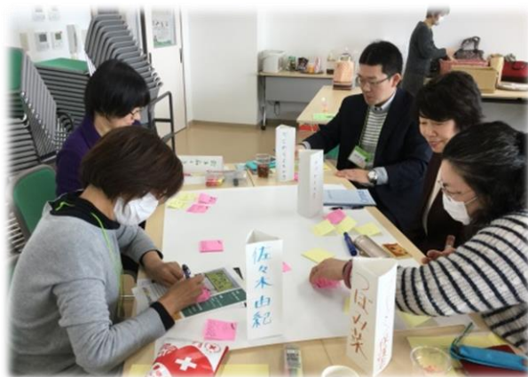
グループワークの様子