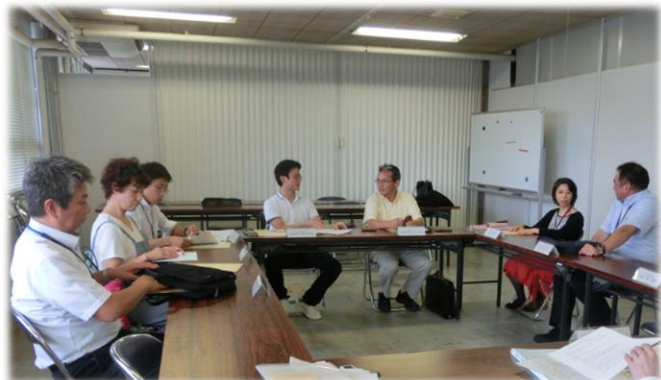
石巻支部委員会の様子

また、今年2月に開催しました支部交流会を、今年度も開催したいと考えております。詳細は決まり次第お知らせしますので、皆様の積極的なご参加をお待ちしております。