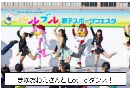
まゆおねえさんとLet'sダンス！

10月30日（日）、石巻専修大学で、約410組・1,400名が様々な教室に参加し、親子で一緒に体を動かして、ルルブルの「遊ブ」を実践しました！晴天の下、広い敷地内で思い切り楽しむ親子の姿が印象的でした。