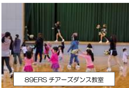
89ERS チアーズダンス教室