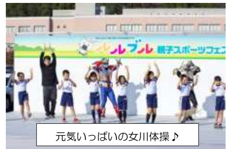
元気いっぱいの女川体操♪

◆野球・サッカー・バスケットボール・陸上・ダンス・ヨガ・体力測定・ニュースポーツ・親子ふれあい体操など、盛りだくさんの教室の他、スタンプラリーも大人気！たくさん体を動かした後は、学生食堂で食事をし、家族一緒につろぐ様子が見られました。