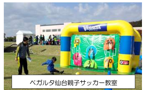
ベガルタ仙台親子サッカー教室