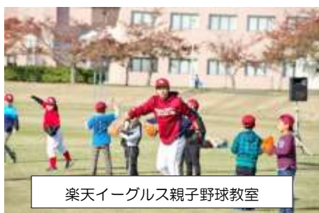
楽天イーグルス親子野球教室

◆「ヨシケイ宮城」・「東北大学災害科学国際研究所」・「宮城県教育委員会」の各ブースにも親子が訪れ、笑顔が絶えない1日でした。