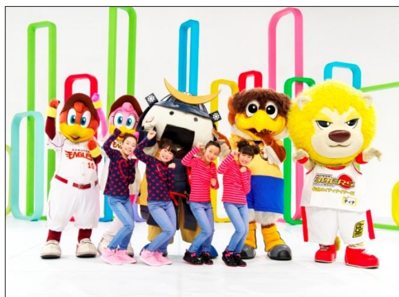
みんなで楽しくレッツルルブルダンス！

さらに、ダンス部分の動画については、宮城県のホームページでご覧になれます。ダンスの振り付け説明書も掲載していますので、ぜひご覧ください！