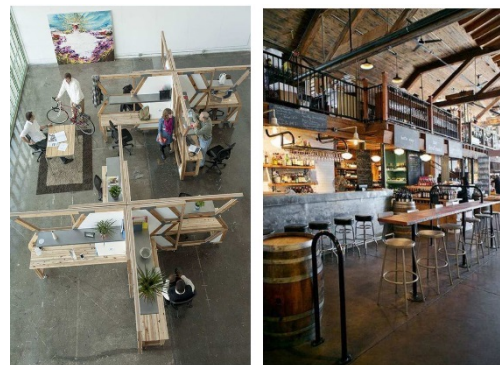
賑わい拠点施設内部イメージ