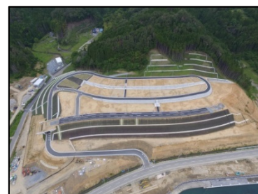
雄勝中心部B地区（伊勢畑） （石巻市）