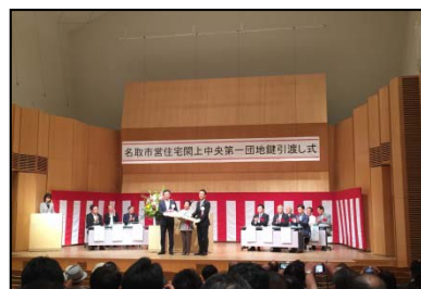
閑上地区鍵引渡し式 （名取市）