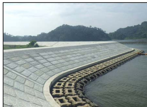
東名地先海岸 (東松島市)