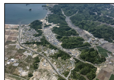
野蒜北部丘陵地区（東松島市）