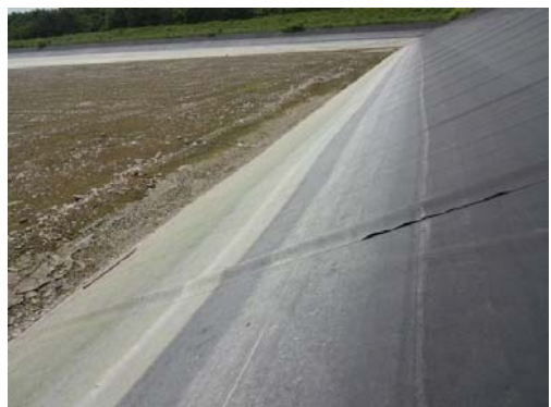
④その他（重ね合わせ部分の剥がれが貫通）