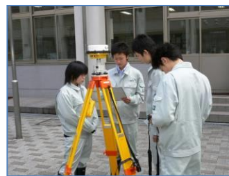
実習風景1(土木情報科)