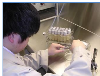
実習風景5(化学技術科)