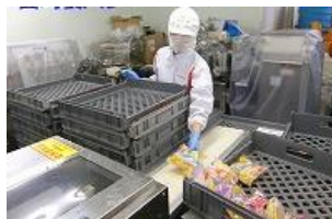
インターンシップ(2年次)