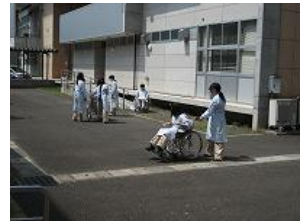
介護実習(福祉系列)