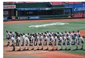
春季県大会(野球部)