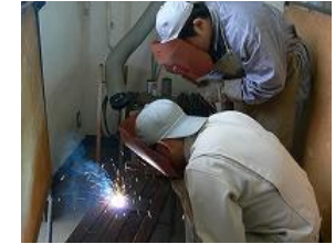
機械実習(機械系列)