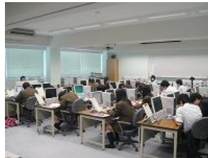
情報処理実習(情報系列)