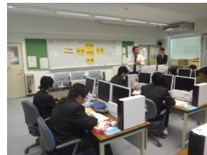
進路別オリエンテーション