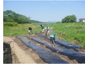
農業実習(農学系列)