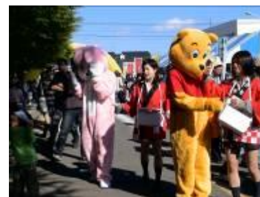
ボランティア活動 (赤い羽募金)