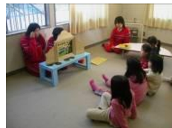
ボランティア活動 (読み聞かせ)