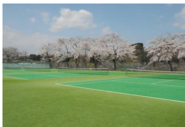
全天候型テニスコート